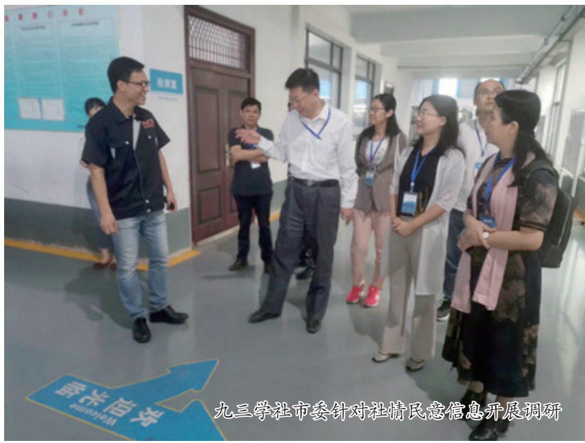
九三学社市委针对社情民意信息开展调研

党派思想工作肩负着内聚人心、外塑形象、记录历史的重要职责，是民主党派自身建设的基础性工程，具有特殊重要的地位和作用，各级政策法规、社中央和社省委的重要决策部署，都要通过宣传思想工作落实到各基层组织和全体社员中去。近年来，九三学社淄博市委坚持把思想工作与重点中心工作、社务工作统筹配合，聚焦“五力”建设，探索新的工作模式，有效推动了思想工作再上新台阶。