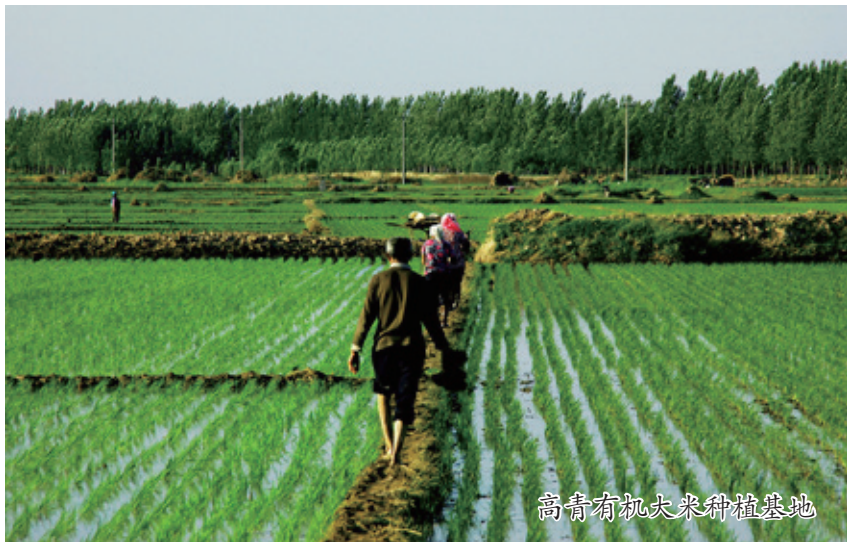
高青有机大米种植基地

一是加强政府引导。学习借鉴菏泽、滨州两市各级成立专门电商办公室、列入政府重点工作考核的经验做法，坚持把发展农村电商作为推动农村产业高质量发展的战略性、先导性新兴产业进行重点培育。充实完善全市各