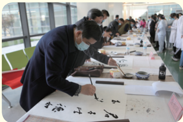
4月23日，市政协书画院组织书法家为一线医护人员赠送书法作品