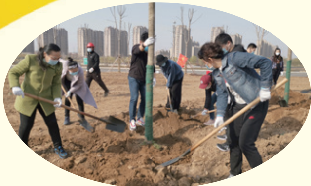
3月12日，市政协组织机关干部到经开区孝妇河滨河公园参加植树活动