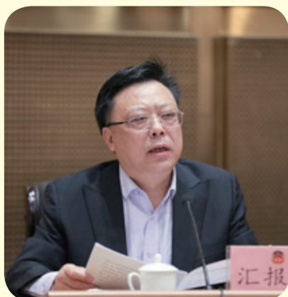
市卫健委党组书记、主任宋晓东汇报我市疫情防控工作情况