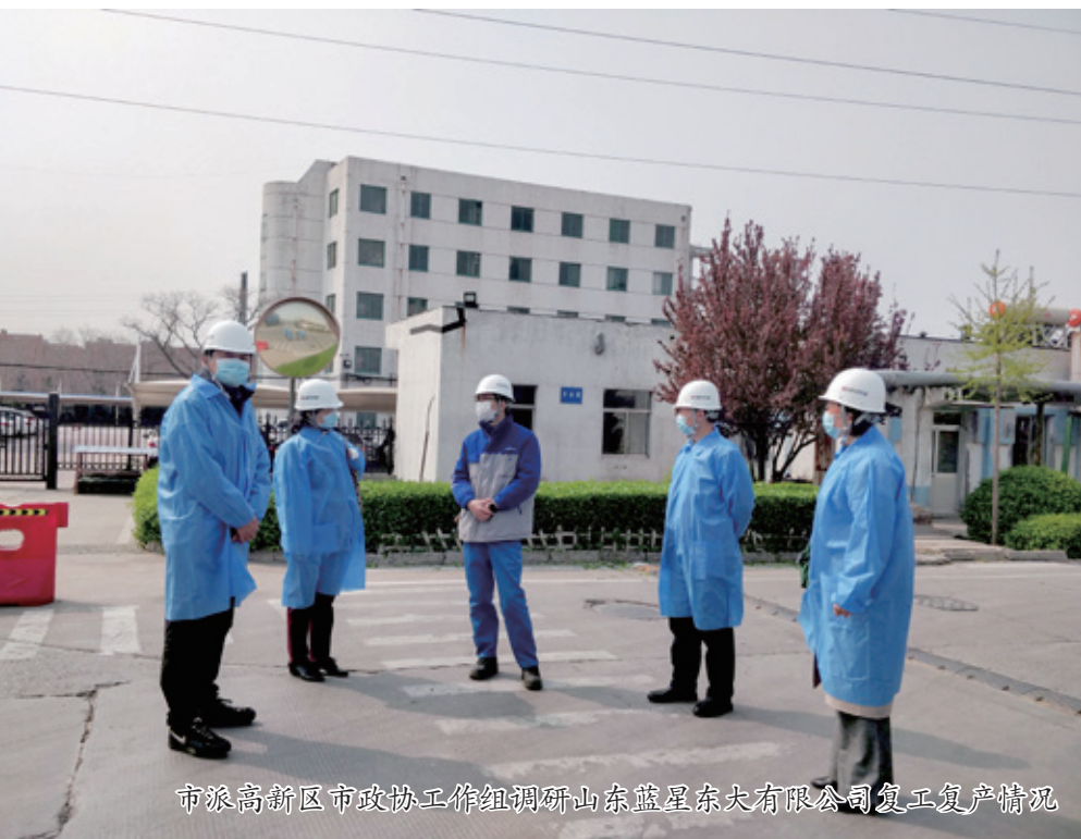
市派高新区市政协工作组调研山东蓝星东大有限公司复工复产情况

车辆到达后，蓝星东大、承包商共同安排专人对每名返岗人员进行体温测量，逐一核对身份证、健康证以及出发地出具的隔离证明，在确认无误后安排入住宿舍，采取统一安排车辆从“宿舍—施工现场”的点对点接送方式安排返岗工作，杜绝了返岗工人与外部人员接触。此举既严格有效防范了疫情的传播风险，又解决了项目建设复工难的问题，为企业项目建设助力。