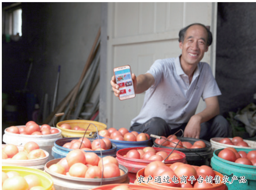
农户通过电商平台销售农产品

五是农村电商服务体系配套滞后。曹县、惠民等地的共同做法是建立电商产业园及公共服务中心，通过要素集聚和创新，打通农产品电商销售生产端、营销端、服务端全生态产业链条。如菏泽市建成51个电商产业园区，入驻电商及配套服务企业3600余家，开展跨境电商企业400家，7县4区全部成立了县级电子商务公共服务中心。目前，我市多数区县还没有建成专业电商产业园，各电商企业各自为战，处于无序竞争状态。由于农村电子商务发展滞后，物流业务单量少、配送成本高、配送周期过长等问题依然比较突出。如我市琉璃制