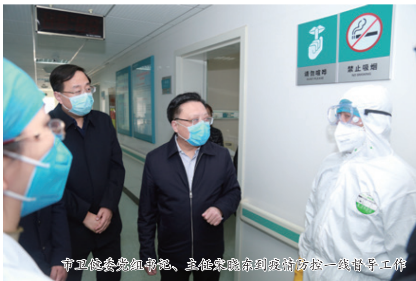
市卫健委党组书记、主任宋晓东到疫情防控一线督导工作

新冠肺炎疫情发生以来，全市卫生健康系统在市委、市政府的坚强领导和市政协的正确指导下，认真贯彻落实习近平总书记重要指示批示精神，按照党中央、国务院决策部署和省、市工作安排，切实发挥牵头部门作用，会同全市各级各部门统筹推进疫情防控和经济社会发展各项工作，坚定不移落实差异化精准防控措施，联防联控、群防群治，疫情防控工作取得阶段性成效。截至4月7日24时，全市累计报告新型冠状病毒肺炎确诊病例30例，其中治愈出院29例、死亡1例，已连续46天无新增确诊病例；累计追踪到密切接触者892人，已解除医学观察879人，13人正在接受隔离医学观察，均未发现异常；本地密切接触者