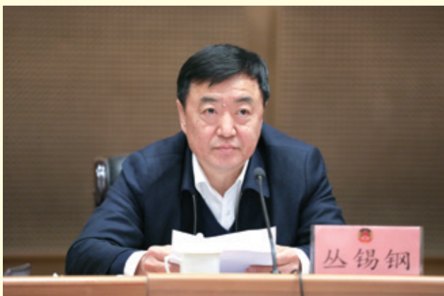
市政协主席丛锡钢主持会议并讲话