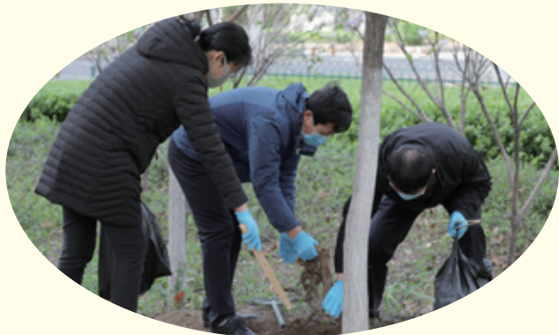
3月27日，为响应市委“全员环保”号召，市政协机关组织志愿者开展社区卫生大清扫