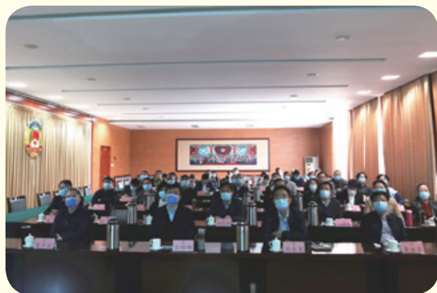
4月26日，市政协机关组织全体党员干部观看纪录片《上甘岭战役》和《冰血长津湖》