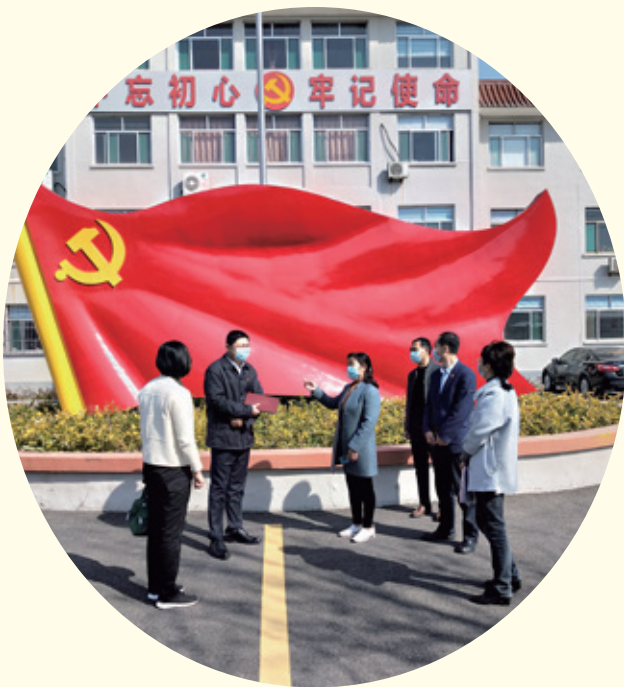
3月18日，市派高新区市政协工作组到服务单位就当前的疫情防控形势及村民生产生活恢复情况进行调研