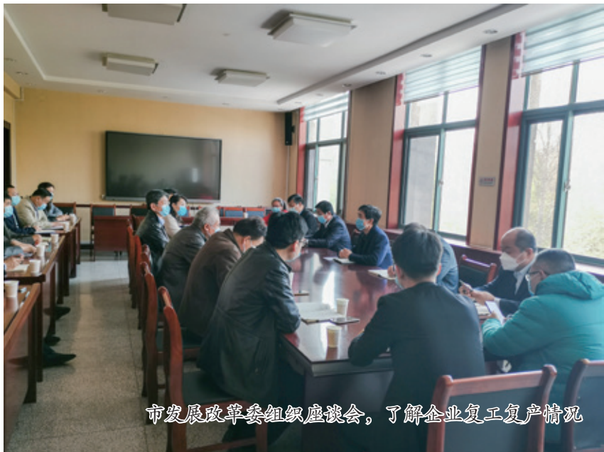
市发展改革委组织座谈会，了解企业复工复产情况

今年以来，面对复杂严峻的国际国内经济形势和突如其来的新冠疫情影响，全市上下在市委、市政府的坚强领导和市政协的监